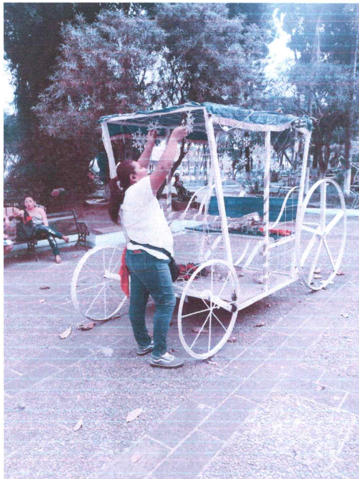
QUITANDO LOS ADORNOS NAVIDEÑOS EN EL PARQUE CENTRAL