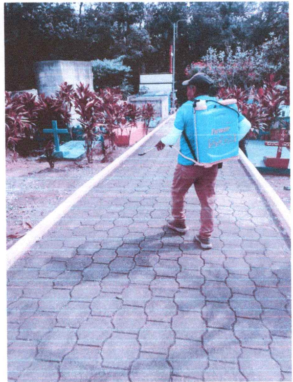
LIMPIEZA DE CALLE DE EMPEDRADO EN EL CEMENTERIO NUEVO DE BARRIO LAS FLORES